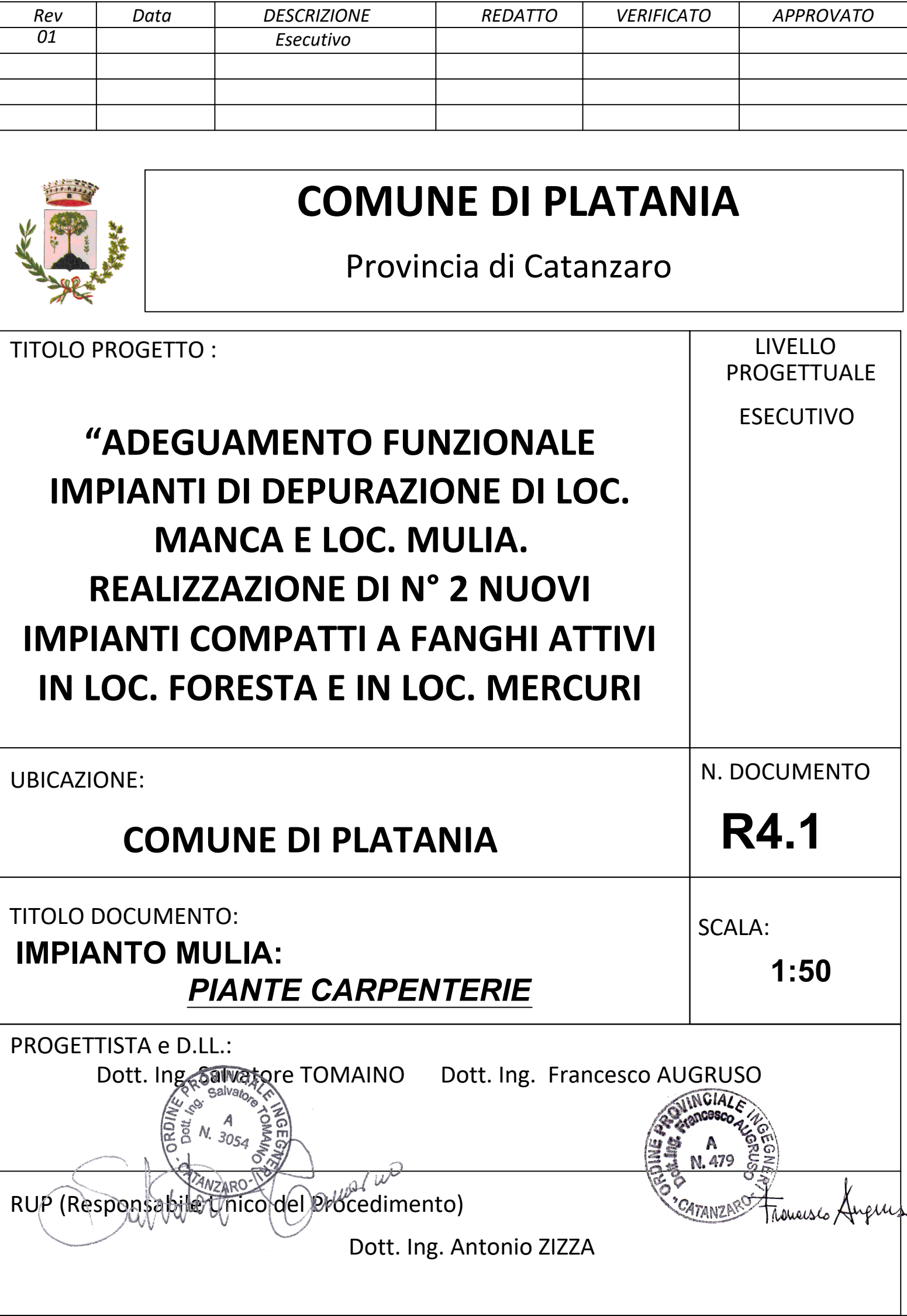
Carpenteria Fondazione (Scala 1:50)